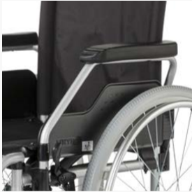
Komfortentnahmefunktion des Seitenteils