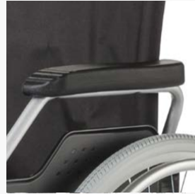
Verriegelbare Armlehnen nach hinten abklappbar