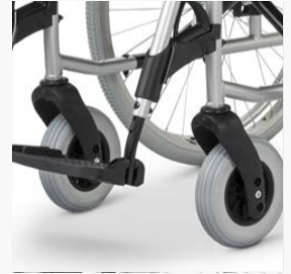
Vordere Sitzhöhe einstellbar ohne Teiletasch